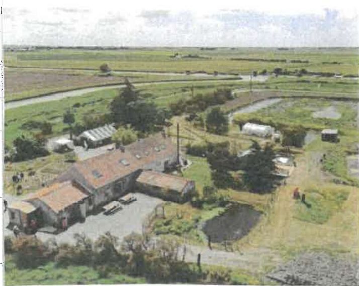
La ferme du fresne en haut