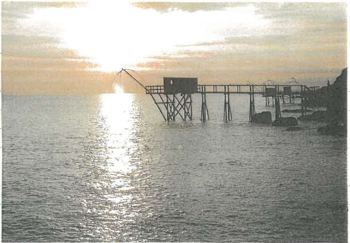
↗ maison de pêcheur à pornic